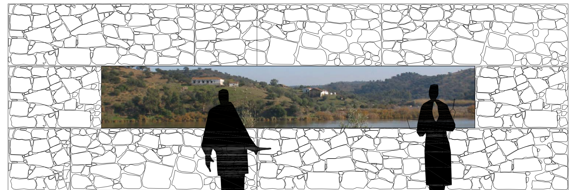
Muro-ventana-mirador de gaviones de laja.